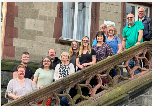
13 komba 8 Verdi